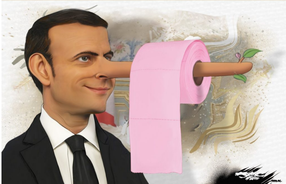
EL DIA SEGÜENT...

És una Europa que assumeix que té fronteres i que les protegeix. Una Europa capdavantera en donar suport massiu a les empreses dels sectors estratègics”.