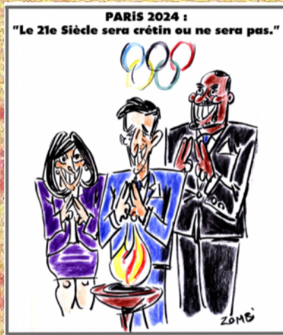
"El segle 21 serà cretí o no serà."

La influència cultural de l'anglès és innegable i la presència creixent en els JO també. Llavors els diputats francesos s'han rebotat i demanen als organitzadors, atletes i periodistes de prioritzar l'ús del francès durant tot l'esdeveniment. Atès que els Jocs moderns van ser inventats per l'aristòcrata francès Pierre de Coubertin a finals del segle 19, i que el francès va ser la llengua franca de les primeres edicions i continua sent una de les llengües oficials del Comitè Olímpic Internacional pels guardians és crucial reconèixer la importància de la llengua en la preservació de la identitat cultural. Llàstima que només ho apliquin a la seva llengua! Però bonic ho és!!!