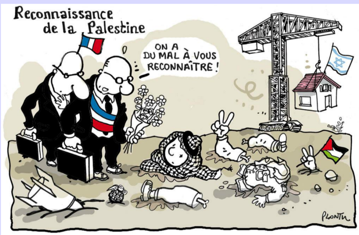
RECONeixEMENT DE PALESTINA - Ens costa reconèixer-la!

Cada any, en la celebració de la Makba, els palestins llueixen la mateixa pancarta: Tornarem. Doncs això.