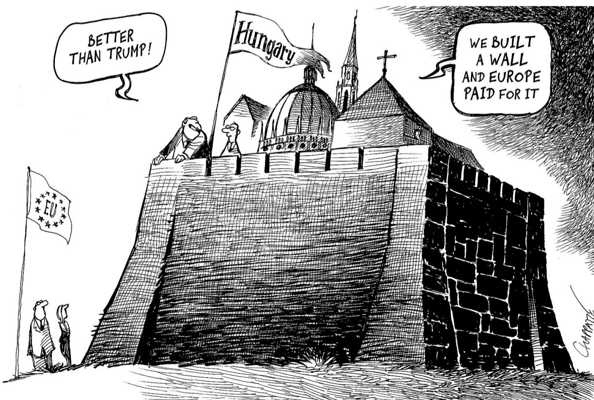
- Millor que Trump! HUNGRIA - Hem construït un mur i Europa el paga

Què ha passat perquè l'Hongria revolucionària dels consells obrers de 1919 de Bela Kun, més tard assassinat per Stalin, i la Hongria de 1986, en revolta obrera i popular contra la invasió de l'exèrcit rus, esdevingués avui ultradretana i prorrussa? Aniran les polítiques de Viktor Orbán a poc a poc corcant els drets i llibertats de que gaudeix avui Europa? Naixeran noves Hongries a l'Europa del futur?