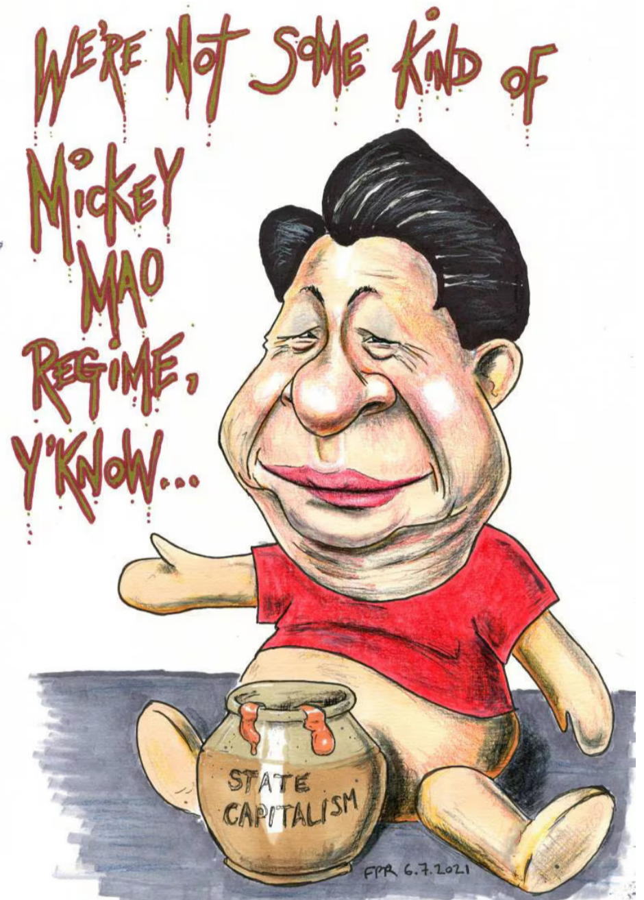
NO SOM UNA ESPÈCIE DE RÈGIM DE MICKEY MAO, SABEU... Capitalisme d'estat

A nivell militar té l'exèrcit més gran del món, amb dos milions de soldats, i s'acosta cada cop més al poder militar dels EUA. La Xina de Xi Jinping d'una manera silenciosa, però cada cop més efectiva, està penetrant a nivell econòmic, cultural, militar, acadèmicament i comunicacionalment a moltes nacions per primera vegada.