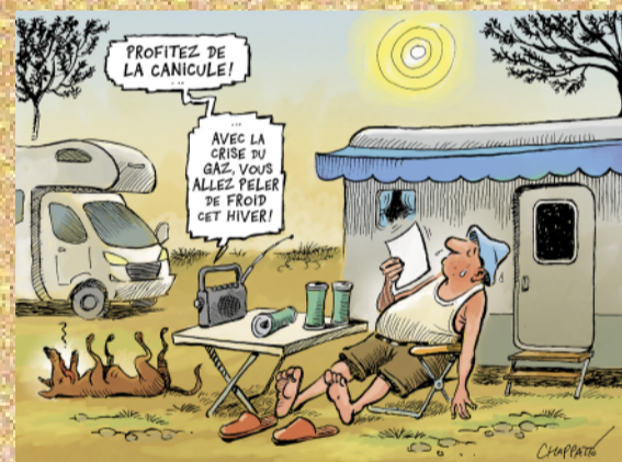
- Aproveu l'onada de calor, amb la crisi del gas us pelareu de fred aquest hivern.

Ho sabíem, ho esperàvem però fot igualment. La temperatura mitja mundial ha pujat fins un límit inèdit. 17'09 graus. Els científics analitzen l'evolució del clima seguint mètodes diferents i punts de comparació desiguals que poden portar a confusió al pobre ciutadà acalorat. En tot cas en això són unànimes. A cadascú d'espiar el seu termòmetre com a consol però la cosa va de molta calor. Bones vacances.