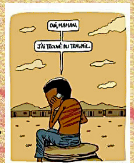
Sí mare. He trobat feina.

El poble té uns 6.000 habitants permanents però en deu rebre entre 60.000 i 100.000 per any. I clar, el pobre home creu que 200 negres són massa negres... si com a mínim fossin menys vistosos! Però, res a fer... el govern mana i ordena i els immigrants arriben i s'hostatgen als hotels. Amb una mica més d'imaginació els pot fer servir de reclam per un bronzejat multisensorial.