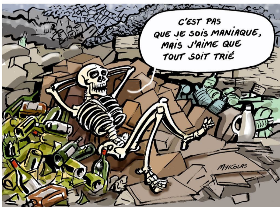
GRAN CAMPANYA PUBLICITÀRIA PEL RECICLATGE - No soc maniàtica, però m'agrada que tot estigui triat

residus de manera que mentre cremem merda italiana (els residus vindran de Itàlia) obtindrem gas amb el que seguir alimentant la planta ja en marxa.