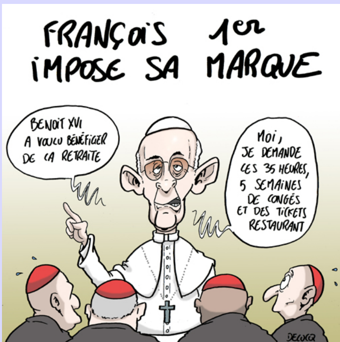
FRANCESC 1er IMPOSA LA SEVA MARCA - Benet XVI va voler beneficiar de la jubilació - Jo demano les 35 hores, 5 setmanes de vacances i els tiquets per anar al restaurant

El Papa Francesc segur que no ha visitat mai aquestes catacumbes, que la seva fe (positiva o no) ha estat sincera, potser sí, una mica infantil, creient que la veritat és el far de l'església. El pobre home morirà sense saber la veritat. De manera directa o indirecta, per disgustos i enfrontaments, és aquesta banca eclesiàstica, aquests interessos foscos els que l'hauran matat.