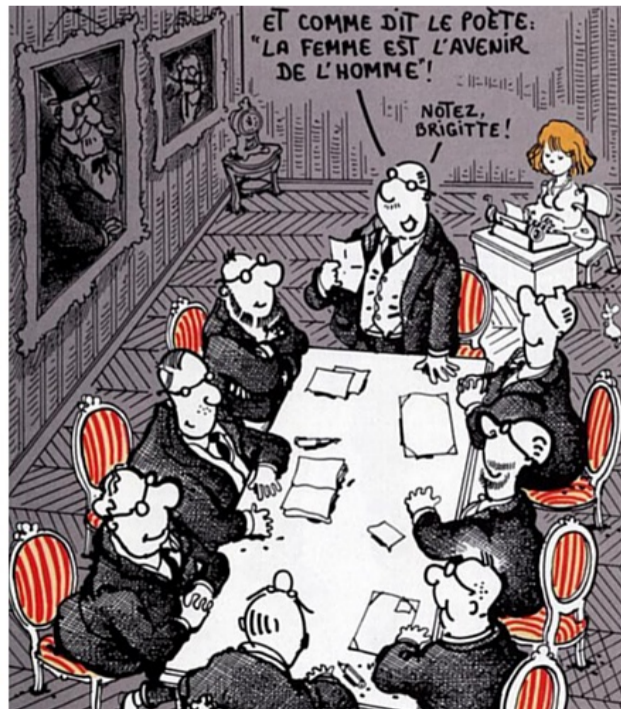
- I com diu el poeta, "La dona est el futur de l'home!" - La nostra Brigitte!